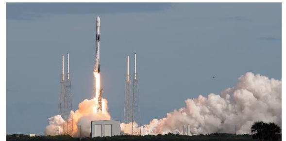
Ilustración 12: https://www.techjuice.pk/spacex-experiencing-issues-with-first-upgraded-starlink-v2-satellite/

https://www.jeffgeerling.com/blog/2022/starlinks-current-problem-capacity