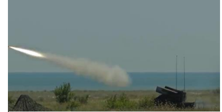
Ilustración 6: imagen de un video del artículo

El AN/TWQ-1 Avenger, también conocido como M1097, es la principal arma móvil de defensa aérea del Ejército de Estados Unidos. Es una unidad de fuego de misiles tierra-aire que es liviana, altamente móvil y fácilmente transportable. Cada Avenger tiene dos módulos de misiles, cada uno con ocho misiles Stinger y una ametralladora FN M-3P calibre .50 (12,7 mm). Los misiles Stinger del Avenger también han demostrado ser efectivos contra vehículos aéreos no tripulados (UAV). En una prueba realizada en abril de 2017, un Avenger disparó Stingers a dos UAV, marcando la primera intercepción del misil de un objetivo UAV.