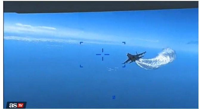
Ilustración 1: https://as.com/actualidad/eeuu-revela-imagenes-del-choque-entre-el-caza-ruso-y-el-dron-estadounidense-n/

https://www.turdef.com/Article/a-su-27-downed-an-mq-9-reaper-on-the-black-sea/2911