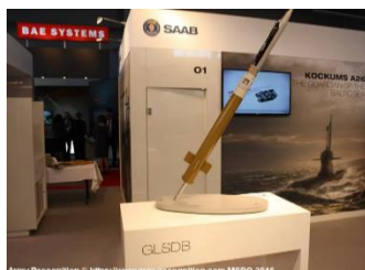
Ilustración 5: del artículo

https://www.armyrecognition.com/united_states_american_missile_system_vehicle_uk/glsdb_ground-launched_small-diameter_bomb_technical_data.html?utm_content=vc-true