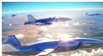
Ilustración 8: del artículo. Concepto sobre la nueva generación de aviones de combate y el empleo de drones

Los drones colaborativos y el dominio aeroespacial de la próxima generación se intensifican con drones que colaboren con el caza tripulado, para llevar a cabo misiones avanzadas de guerra electrónica, supresión de defensas aéreas enemigas, protección aérea, terrestre y comunicaciones.