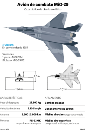
Ilustración 2: del artículo en el diario Clarín

El presidente Andrzej Duda ha anunciado que entregará cuatro aviones de combate a Ucrania “en los próximos días”, convirtiéndose en el primer miembro de la OTAN en hacerlo desde la invasión rusa de Ucrania. El anuncio se produce después de que los líderes de Polonia dijeran la semana pasada que el envío de aviones de combate solo se haría dentro de una coalición internacional más grande. Duda no indicó que se hubiera formado tal coalición. El movimiento para enviar los aviones MiG-29 convertiría a Polonia en el primer miembro de la OTAN en entregar aviones de combate que Kiev ha pedido para luchar contra las fuerzas rusas. El ex subsecretario de defensa adjunto de Estados Unidos cree que los MiG serían una mejor opción: “ Son aviones que Ucrania ha volado antes y que puede respaldar. Y creo que primero tenemos que recurrir a eso. Y podría ser, para que esos aviones se envíen a Ucrania, Estados Unidos podría rellenar con F-16 para ese país que está renunciando a sus antiguos aviones soviéticos ”.