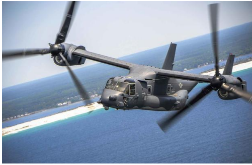
Ilustración 11:

Tanto la Marina, como el Cuerpo de Marines y la Fuerza Aérea norteamericana coinciden en que no estarían necesitando un gran presupuesto para adquirir aviones nuevos. La noticia llega en mal momento para Osprey, que se encuentra bajo un intenso escrutinio debido a problemas técnicos que han causado al menos 15 incidentes durante la vida útil de la aeronave.