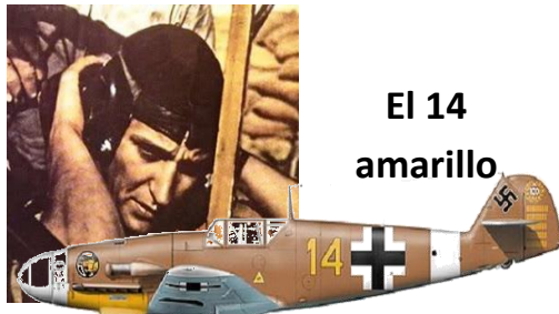
El 14 amarillo

Adolf Galland dijo: “Marseille fue un virtuoso sin rival entre los pilotos de caza de la II Guerra Mundial. Sus logros han sido considerados como imposibles y, tras su muerte, estos no han sido superados por nadie”. Se destacó por su capacidad y precisión en los combates aéreos durante la campaña en norte de África, y se lo consideró como uno de los mejores pilotos de caza de la II Guerra Mundial. Le apodaban Stern von Afrika (la estrella de África ). Logró 158 derribos confirmados oficialmente, volando siempre un Messerschmitt Bf 109, lo que lo convirtió en el piloto que derribó la mayor cantidad de aviones de los aliados occidentales.