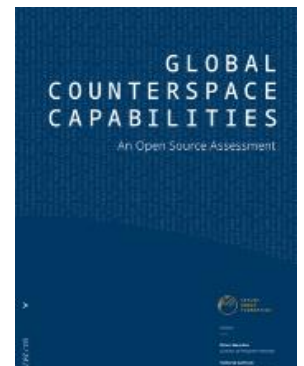
Ilustración 4: tapa del informe de la Secure World Foundation

La seguridad espacial se ha convertido en una cuestión política en los últimos años y ha habido una creciente preocupación por parte de varios gobiernos por la dependencia de las capacidades espaciales, vulnerables para la seguridad nacional. La proliferación de capacidades contraespaciales ofensivas podrían usarse para interrumpir, negar, degradar o destruir los sistemas espaciales. Esto, a su vez, ha llevado a una mayor retórica de algunos países sobre la necesidad de prepararse para futuros conflictos en la Tierra, que se extiendan al espacio. El espacio no es dominio exclusivo de los servicios militares y de inteligencia. La sociedad y la economía global dependen cada vez más de las capacidades espaciales, y un futuro conflicto en el espacio podría tener repercusiones negativas masivas a largo plazo. Incluso, la prueba de estas capacidades podría tener repercusiones negativas en la Tierra. Este dominio requiere el desarrollo de las diferentes opciones políticas, como sería el caso de otros problemas de seguridad nacional en los dominios aéreo, terrestre y marítimo.