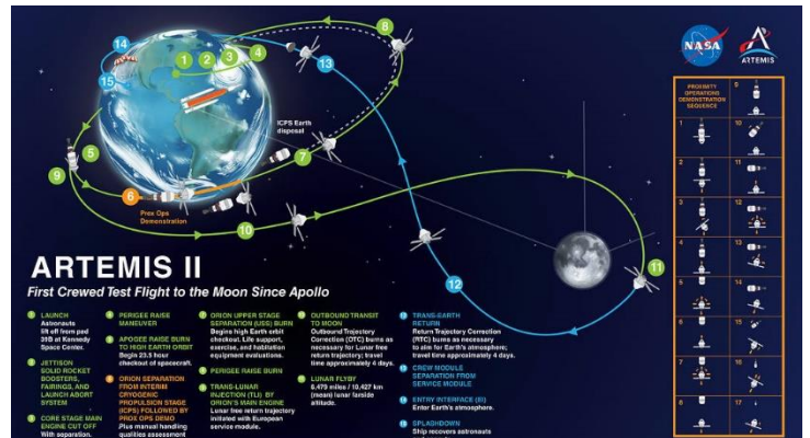
Ilustración 14: mapa de Artemis II, del artículo

https://www.space.com/news/live/nasa-artemis-2-moon-mission-updates?utm_term=C341BA23-A970-42C4-B4A3-6F3D3ED3CFF5&utm_campaign=58E4DE65-C57F-4CD3-9A5A-609994E2C5A9&utm_medium=email&utm_content=E317D840-6EB3-4B17-B5DF-D8CEB603319E&utm_source=SmartBrief